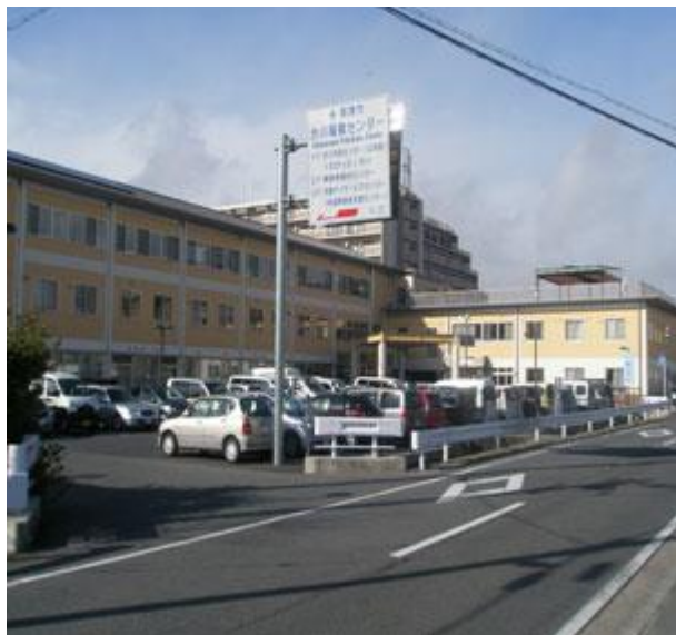
渋川福祉センター全景