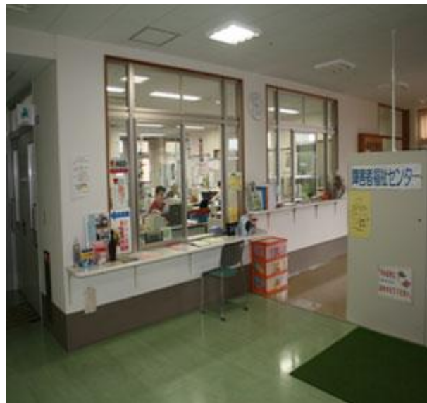
2F 障害者福祉センター受付窓口